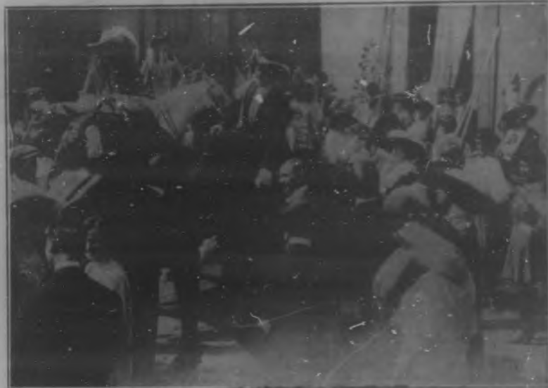
Una escena de la película "La amazona enmascarada" cinematográfica obra que estrenarán en breve Santos y Artigas.

yendo desahuciarasno oyentes. Una de las muchachas que estaban a su espalda le advertió