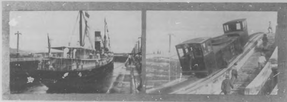
EN EL CANAL DE PANAMA.—"Allianca", el primer trasatlántico que ha pasado el canal, para prueba de las celebres esclusas de Gatún. Potentes maquinarias de tracción que le movieron a los buques por el Canal.

"Hojas sueltas".—Ya está en Prensa el libro "Hojas sueltas" de que nos ocupamos días atrás en estas notas.