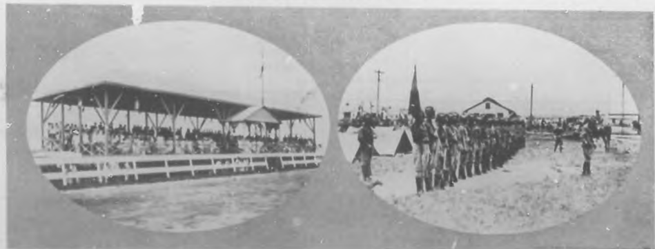
EJERCICIOS MILITARES.—Vista del "stand" del campamento de Columbia en la tarde de ejercicios. Los alumnos de la Escuela Militar esperando la orden para armar las tiendas de campaña.

Cruzando el canal.—Por vez primera un vapor transatlántico ha pasado por las esclusas de Gatún, ascendiendo del canal a nivel del mar hasta el lago de Gatún que se encuentra a una altura de 85 pies. El vapor "Allianca" ha sido designado por el coronel Geothals para hacer el primer ensayo de las esclusas, saliendo del puerto de Cristóbal a las 6 de la mañana, llegando a Gatún a las 15 minutos después. Ascendió perfectamente el "Allianca" movido por cuatro locomotoras denominadas "mulas eléctricas". Las compuertas maniobraron con toda regularidad. Fue una fiesta muy animada el paso del "Allianca" por el canal.