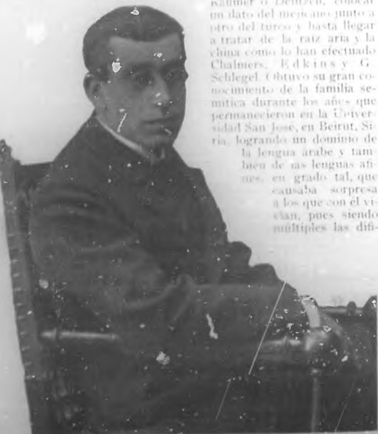
Dr. Julio Cejador, eminente filólogo y uno de las glorias más doctas de la literatura mundial.