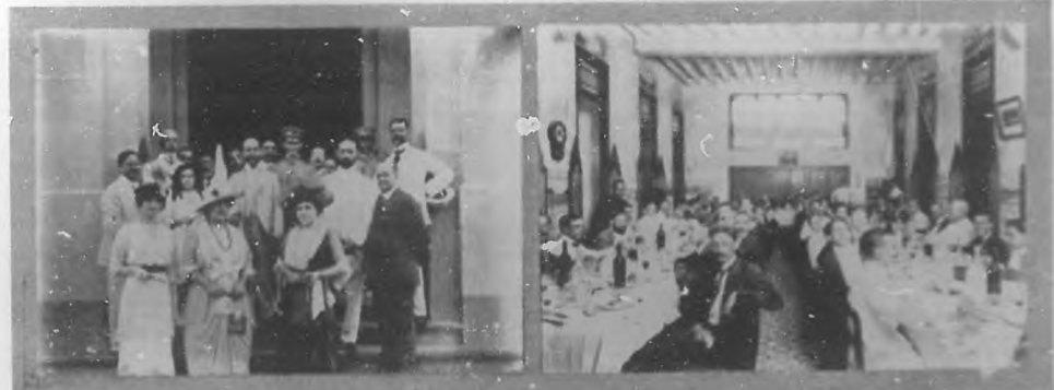
EN EL HOSPITAL MERCEDES. Acto de la inauguración de los nuevos aparatos eléctricos instalados para servicios del establecimiento. El Dr. Rodríguez Roldán y los Sres. Presidente de la República, General Freyre y distinguidas damas en el salón de actos. "La Anunciata". Solemnes fiestas de los congregantes. Banquete con que los catequistas celebraron la fiesta.

Exploradores Cubanos. Las practicas de los Exploradores de Cuba, se estan efectuando con toda regularidad. Estas tienen lugar los jueves y domingos por la tarde y a ellas concurren la mayoría de los inscriptos. El punto de reunion es en la "Casa Club" Monse- rante 13, de donde se traza el itinerario del día. Del entusiasmo que reina en estas son pruebas fehacientes las fotografías tomadas en el curso de estas. Las que en esta ocasion se publican, fueron tomadas durante la excursion que al "Naranjito" verificaron la semana pasada y la cual a pesar de la lluvia que en la Vivora les sorprendió lesaron a cabo sin omitir ningún detalle del programa de autentico trazado por el Comiteo general. El sábado de la semana pasada tuvo lugar otra excursion de practica y esta se efectuó teniendo como punto de partida la Habana y punto de termino Caminar. En esta excursion, tengo que consignarlo con satisfacción, todos los Exploradores, estuvieron a la altura de su cometido, pues a pesar de la lluvia reinante que les esperaba en Casa Blanca no dieron en ningún instante señales de amedrentarse por