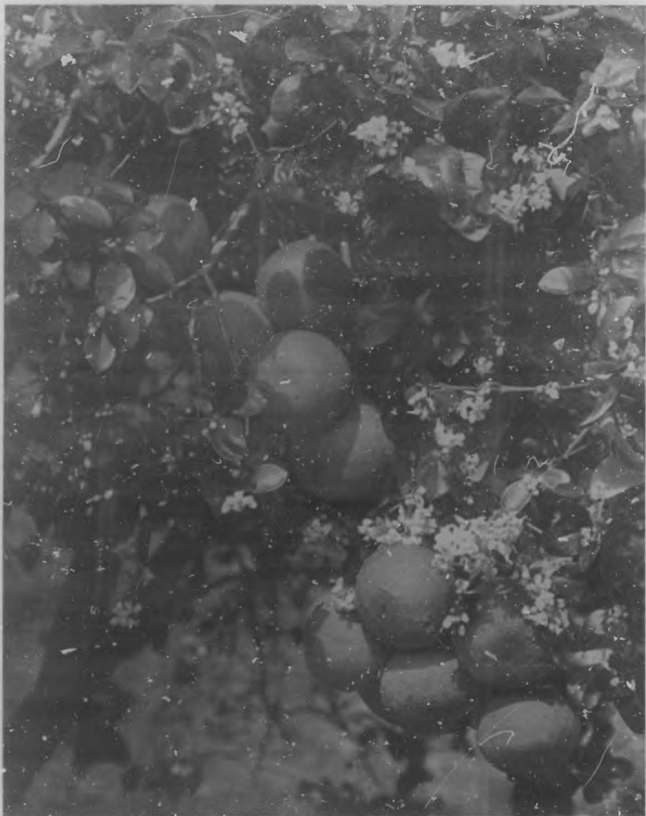
Hermoso ejemplar de naranjo cuajado de azahar y delicioso fruto, que si es nota viva de la feracidad de los campos de Cuba, es también la magia y brillante estrofa de la poesía de la naturaleza.